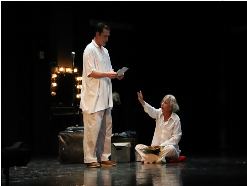
( http://www.aytomoguer.es/export/sites/moguer/es/.galleries/fotos-noticias/2018/01/IMG_1796.jpg )