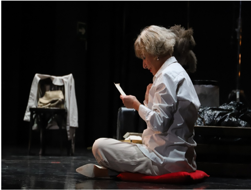
( http://www.aytomoguer.es/export/sites/moguer/es/.galleries/fotos-noticias/2018/01/IMG_1803.jpg )